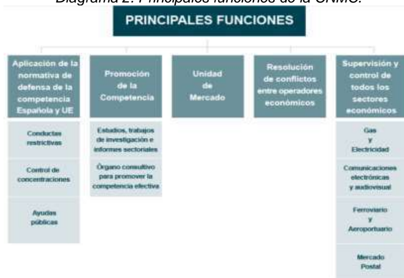
Diagrama 2. Principales funciones de la CNMC.

Los acuerdos se adoptan por mayoría de votos de los asistentes. En caso de empate decidirá el voto de quien presida la reunión.